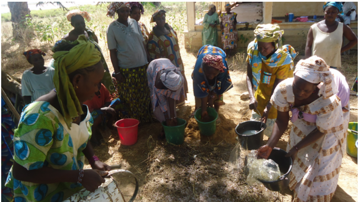
Terre et Humanisme Formation des femmes à l'agroécologie

A l'international, Terre & Humanisme et ses partenaires structurent un programme triennal en Afrique de l'Ouest sur 3 pays . Au Mali, au Burkina Faso, au Togo, elle coordonne les actions de neuf partenaires, dont 4 centres de formation. 150 groupements de paysans et villages sont accompagnés chaque année. En 2016 près de 4000 familles, soit 25.000 personnes bénéficient des retombées économiques et sociales positives.