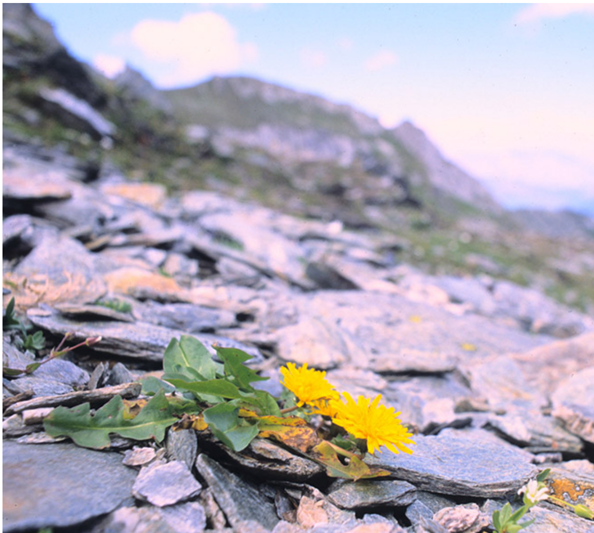
Photo: Pissenlit alpin ( Taraxacum alpinum ) à Grächen - Pascal Vittoz, biologiste à l'université de Lausanne.

Le pissenlit alpin est injustement sous-estimé. Grâce à ses petits parachutes, il s'est montré le plus rapide à s'installer parmi les pierres, à plus de 3200 m d'altitude. La progression de la petite fleur jaune n'est pas anodine. Elle préfigure la remontée d'une végétation de plus en plus diversifiée qui profite de la diminution des durées d'enneigement pour coloniser de nouveaux sommets. Ces dernières années, le biologiste de l'Université de Lausanne Pascal Vittoz a répertorié 87% de nouvelles espèces dans 37 lieux situés au-dessus de 2800 m. Si la limite de la forêt est remontée à 2300 m, les arbres de plaine, par contre, sont en danger. Les différents modèles prédisent un climat trop sec en été pour les arbres indigènes et trop froid en hiver pour les espèces méditerranéennes. Des pelouses steppiques pourraient alors remplacer certaines forêts.